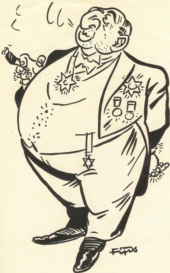
Der anständige Jude