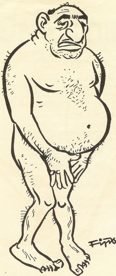
Die nackte Wahrheit