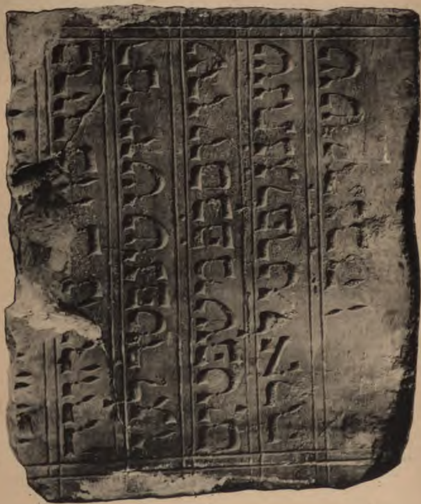
STÈLE RABBINIQUE TROUVÉE, A ORLÉANS, EN 1883