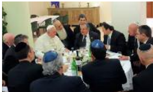
En janvier 2014, Bergoglio a invité au Vatican une délégation de rabbins argentins auxquels il a offert un repas rigoureusement casher