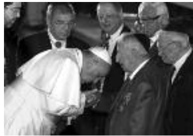
Bergoglio baise les mains de juifs déportés pendant la 2nde guerre mondiale

Pour parler simplement (et donc peut-être de manière imprécise). Toute société requiert une autorité. L'autorité n'est pas une fin en elle-même : elle a la charge de pourvoir au bien commun de la société. Elle pourvoira au bien commun au moyen d'actes volontaires, qui de manière convergente et habituelle, et non rare et épisodique, réalisent effectivement le bien commun. Une autorité qui de fait – réellement et efficacement – réalise le bien commun de la société qu'elle doit gouverner, a le droit à l'obéissance des sujets ; une 'autorité' qui non de manière épisodique, rarement, mais habituellement, NE réalise PAS le bien commun de la société qu'elle doit diriger, bien commun qui est toute sa raison d'être, N'est PLUS formellement l'autorité, n'a plus le droit à l'obéissance et à la soumission des membres de la société. Et ceci quels que soient les MOTIFS subjectifs pour lesquels l'autorité agit ainsi, qu'il ne revient pas aux particuliers de juger et qui peuvent être aussi – subjectivement – pleins de bonnes intentions, Deus scit . Ce que nous venons de dire vaut pour toute autorité, y compris pour l'autorité temporelle de l'État, et donc vaudra aussi pour l'autorité spirituelle : la grâce ne supprime pas la nature, mais la perfectionne.