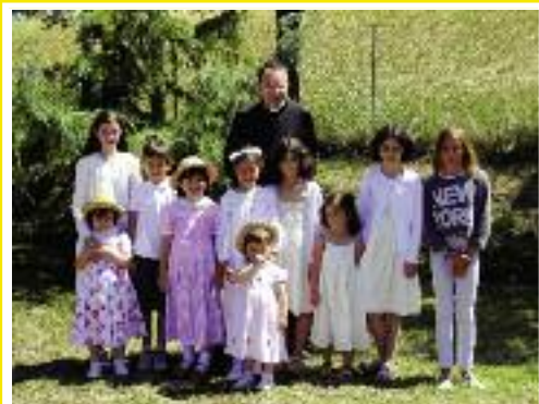
• Annecy : premières Communions