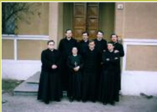
Au-dessus : la première maison de l'Institut à Nichelino Au-dessous : les prêtres et les séminaristes de Orio avec la première sœur de l'Institut