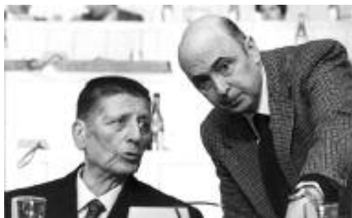
Giorgio Amendola et Giorgio Napolitano

dant à la fameuse loge “Propagande maçonnique” du Grand Orient). “La documentation – concluent Pruneti et Mola – démontre qu’une grande partie de notre histoire s’est écoulée aussi entre les colonnes des temples, où tant d’Italiens de valeur se sont formés aux principes de la liberté et de la tolérance”. Rome, 21 novembre 2013”.