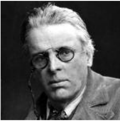
William Butler Yeats