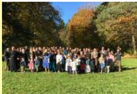
• Récollecion à Raveau le 1 er novembre