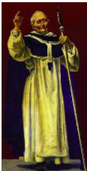
Saint Antonin, évêque de Florence

vrait être le “chef” visible de l’Église (sans l’être, à cause de l’absence d’intention objective de gouverner l’Église à sa fin) et auquel participent ceux qui déclarent être dans son ‘obéissance’ ( ‘una cum’ ).