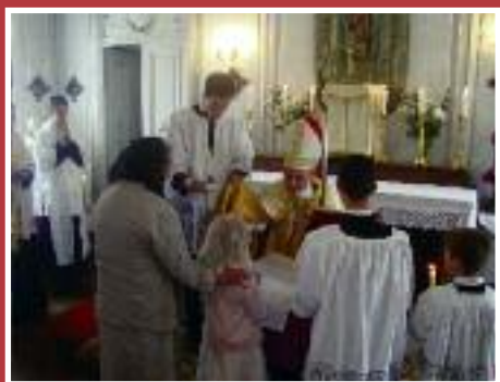
• Confirmations à Raveau

- 2015, le 14 ème (14/11) : “Ipsa conteret Elle t’écrasera la tête (Gn. 3, 15) : le rôle de la T. Sainte Vierge Marie dans la défense de la foi”.