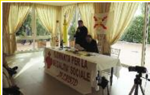
• Modène : Journée pour la Royauté Sociale 2015