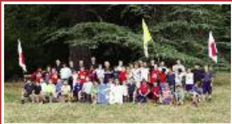
• Camp saint Louis de Gonzague à Raveau en 2015 • Représentation des enfants français