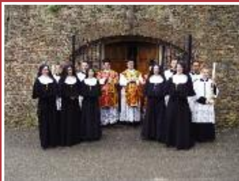
• La profession d'une religieuse de l'Institut