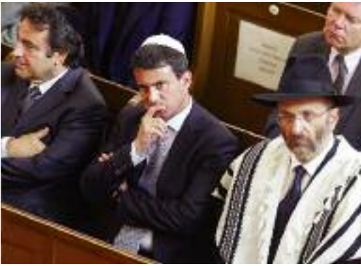
Manuel Valls (à la synagogue)