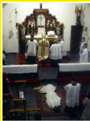
• Ordination au sous-diaconat à Dendermonde