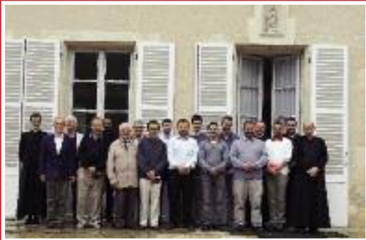
• Exercices Spirituels à Raveau (août 2015)