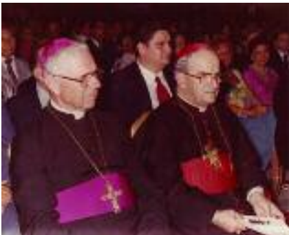
Le cardinal Silvio Oddi (à droite)