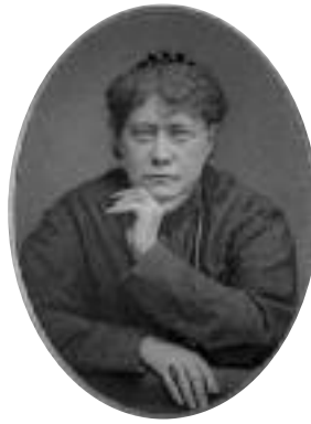
La théosophe Madame Blavatsky