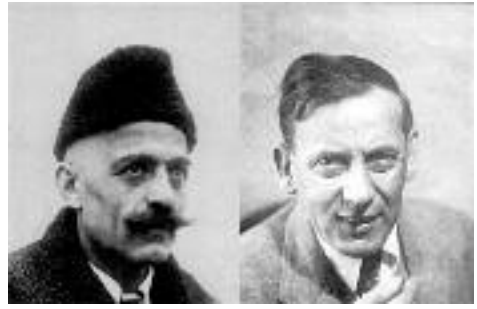
Gurdjieff et Orage