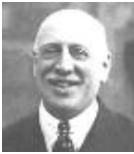
Clifford Hugh Douglas