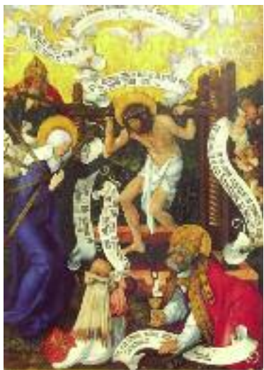
Ansbach (Allemagne), église de Saint Gumbert : Marie Coré- demprice et le Pressoir Mystique (École de Dührer)

Sens accomodatice : c'est celui qui est représenté dans les peintures du Pressoir Mys-