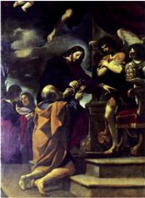
C'est le Christ qui communique à Pierre le pouvoir papal qui le constitue formellement l'Autorité dans l'Église (tableau du Guerchin)

nitence, l'absence de douleur suffisante (attrition) chez le pénitent, invalide le sacrement (puisque les actes du pénitent constituent la quasi-matière du sacrement). L'exemple le plus approprié est celui du mariage, qui est généré précisément par le consentement des contractants. Le consentement doit être extérieur, mais il n'est pas suffisant qu'il soit seulement extérieur : un vice de consentement, même intérieur, même seulement chez l'un des contractants, rend invalide le consentement et par conséquent le mariage même. La situation des époux putatifs, cependant, n'est pas la même après le consentement matrimonial, même s'il est seulement apparent et invalide. Si, réellement et devant Dieu, ils ne sont pas mariés (c'est pourquoi – s'ils sont conscients du fait – ils ne peuvent se considérer mariés et ne peuvent, en conscience, accomplir l'acte conjugal objet du contrat) toutefois juridiquement et devant l'Église ils sont encore considérés comme étant unis par le lien conjugal (en vertu du consentement extérieurement échangé devant les témoins) tant que ledit lien n'a pas été déclaré nul canoniquement par la légitime autorité ecclésiastique. Pas seulement. Le consentement