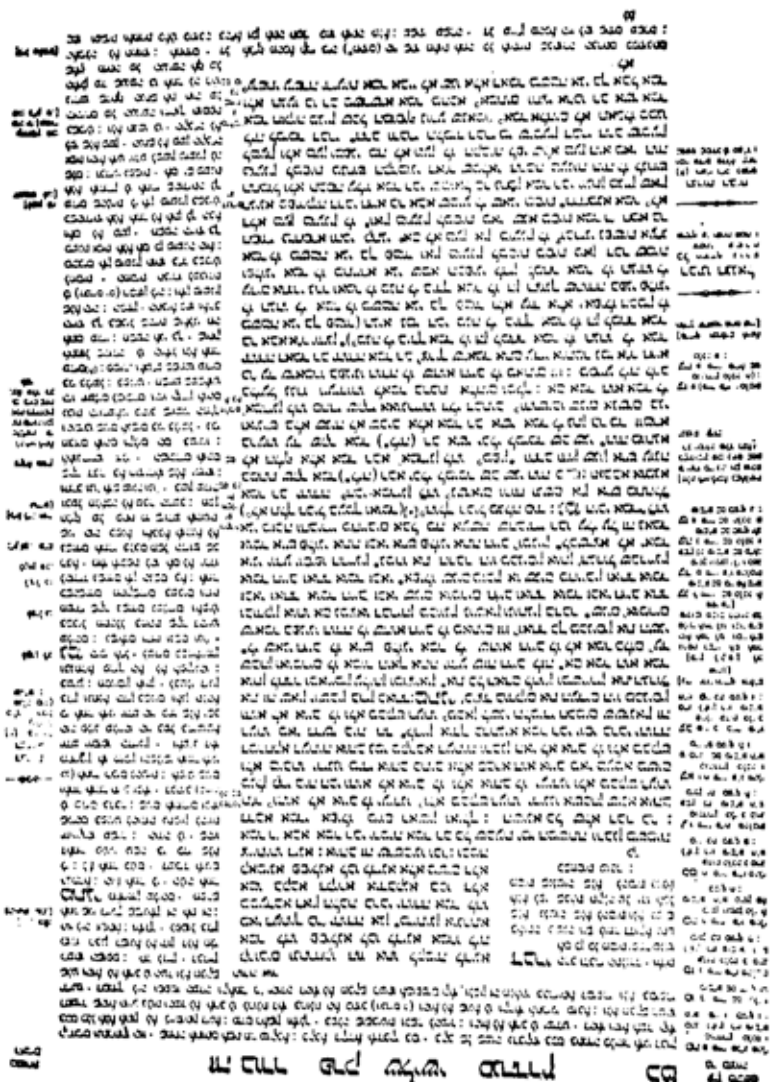
Fac-simile di una pagina del Talmud babilonio