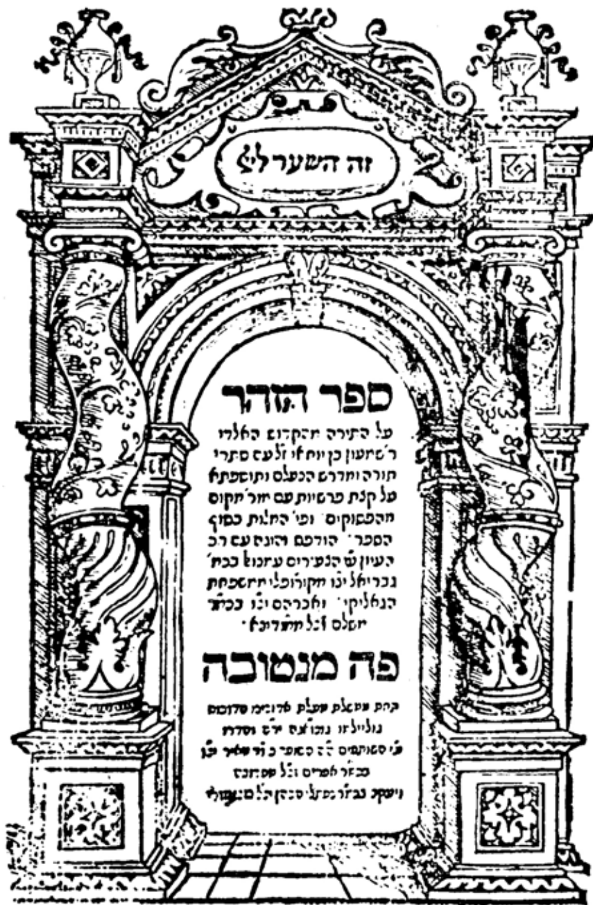
Fac-simile della copertina dell'edizione « Princeps del Zohar » (Mantua 1560)

interpretazione della Rivelazione Divina, ossia nella Kabala e nel Talmud . E' per loro cosa sacra perpetuarlo ed estrinsecarlo.