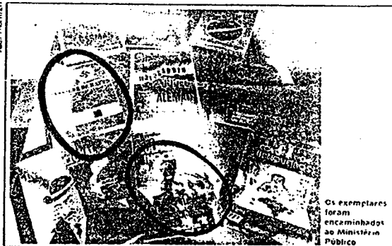
Os exemplares foram encaminhados ao Ministério Público

Ao pedido de providências, o Movimento de Justiça anexou o discurso que o chanceler Helmut Schmidt, da República Federal da Alemanha, fez por ocasião do quadragésimo aniversário da famosa Noite dos Cristais, quando centenas de