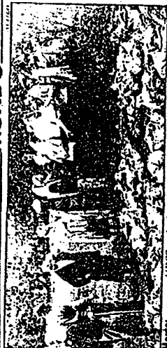
Morte: agora, URSS pede desculpas pela morte de 1940

HISTÓRIA — O serviço em inglês da Rádio de Moscou antecorreu-se