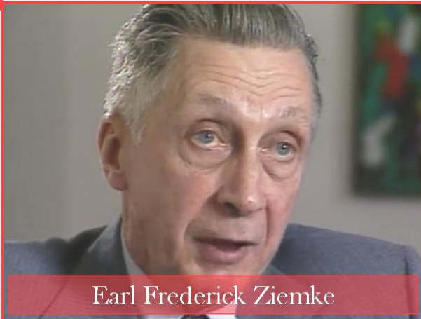
Earl Frederick Ziemke