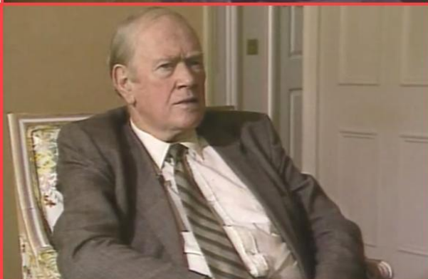
Reginald Victor Jones