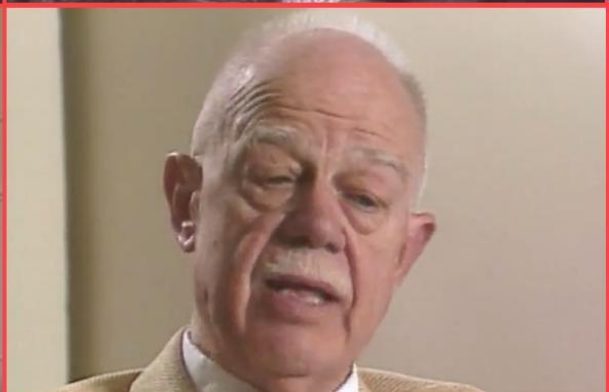
Trevor Nevitt Dupuy

Nous savons tous qui a gagné la guerre. Nous, Américains, admirons la valeur de nos hommes dans les forces alliées qui se sont battus sur la terre, la mer et dans les airs, pour libérer les nations captives et frapper la tyrannie nazie. Pour nombre d'entre-nous l'histoire est simple : les armes américaines et les ressources américaines ont gagné la guerre. C'est l'opinion généralement admise.