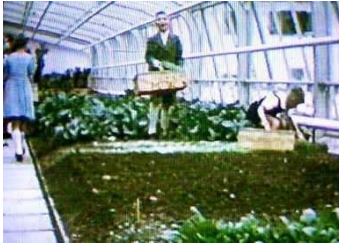
Os filhos de Martin Bormann em 1940 apanhando vegetais no invernadouro ( estufa ) de Adolf Hitler em Berchtesgaden.