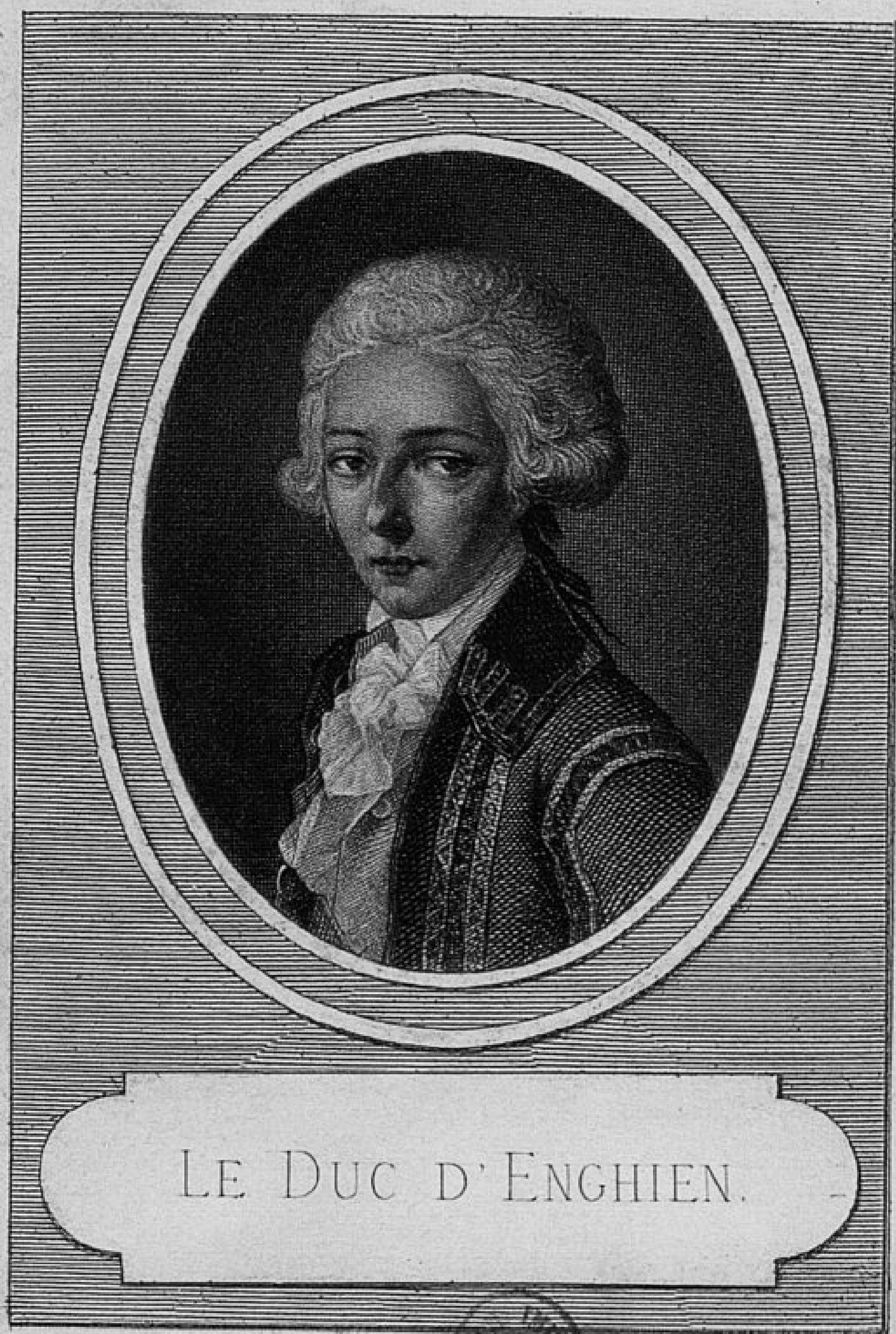
LE DUC D'ENGHIEN.