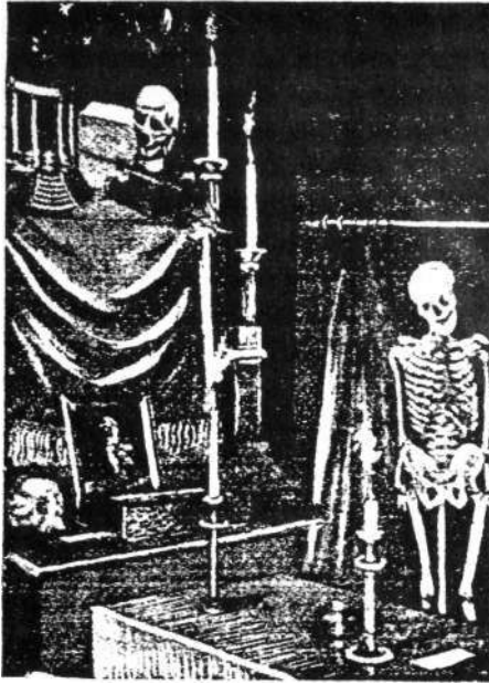
Aspecto de um recinto de sessões da Burschenschaft