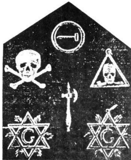
Símbolos usados pela Burschenschaft.