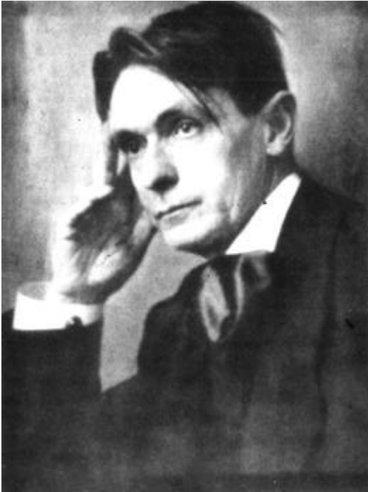
¡Error! Marcador no definido. (Rudolf Steiner 1918)

La exposición de este libro está basada en el pensar intuitivo puro vivenciable puramente a nivel espiritual, por el cual toda percepción adquiere realidad en el acto de conocer. En este libro no se ha querido exponer más que aquello que puede describirse a partir de la experiencia del pensar intuitivo. Pero también se ha querido subrayar qué clase de configuración de pensamiento exige este pensar vivo. Y exige que no se niegue que éste constituye en el proceso de conocimiento una experiencia basada en sí misma. Exige que se reconozca que este pensar conjuntamente con lo percibido, es capaz de experimentar la realidad, en vez de tener que buscarla en un mundo inferido que se apoya más allá de dicha experiencia, en contraste con la cual, la actividad del pensar humano, sería algo puramente subjetivo.