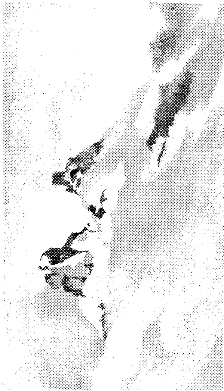
Monte Melimoyu Acuarela de Carolina Matte Fernández