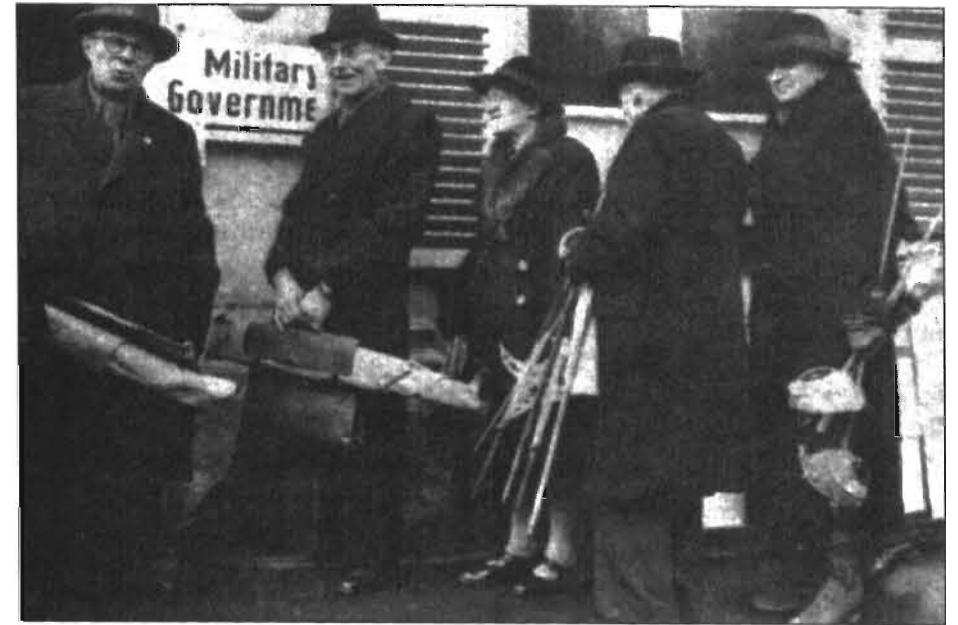
GERMAN CIVILIANS were ordered by American occupiers to turn in all of their weapons (including fencing swords, as held by the man at the right) in 1945. They lined up at collection points all over Germany to do so. GIs were amazed that German civilians owned so many firearms.

Five years later, in 1933, the National Socialists were in power, Hitler