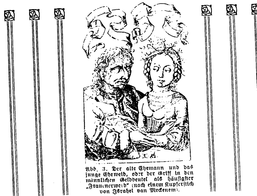
Abb. 3. Der alte Ehemann und das junge Ehemweib, oder der Griff in den männlichen Geldbeutel als häuslicher „Frauenerwerb“ (nach einem Kupferstich von J. Strahl van Meenen).

Seit jeher schon gab es Weinbüter, Schafbüter und Schweinebüter, doch seit den Zeiten des Liberalismus und der Pöbel- und Weiberherrschaft gibt es auch „Hüter“ und „Hüterinnen“ der Sittlichkeit, die ihre Schnüffelnasen fortwährend nach „Unsittlichkeiten“ herumgehen lassen. Dabei treten sie wacker in Wort und Tat für freie Liebe ein, so daß man wohl auch heutzutage mit der Herzogin Viselott sagen kann: „Ich bin sehr Ew. Liebden meining, daß die Lorbeerern besser siehet, als diejenige, womitt die meisten weiber hir im landt ihre Männer crönen.“ Freie Liebe und Hütereie der Sittlichkeit, wie reimt sich das zusammen? Wenn es auf mich ankäme, sollte jedes Töpschen sein Deckelchen haben und viel Jammer und Elend wäre aus der Welt geschafft. Ich habe meine toleranten rassienphysiologisch begründeten Anschauungen an anderen Orten dargelegt, so daß ich nicht zu besüchtigten brande, in den Verdacht eines Sittlichkeitsapostels und moralischen Splitterrichters zu kommen. Ich will hier nur darlegen, in welsch urdrollige Situationen jene „aschamigen“ Prophetinnen kommen, die beim Manne alle „Unsittlichkeit“ mit solch blindwütendem Fanatismus bekämpfen, daß sie völlig übersehen, wie sie selbst im „tiefsten Sumpf“ drinstecken. Im Februar 1909 brachten die „Münchener Neuesten Nachrichten“ ein Schreiben aus Graz, in welchem es heißt: „In der Zeitschrift „Hochland“ hat der Germanist unserer Universität, Hofrat Schönbach, eine Kritik