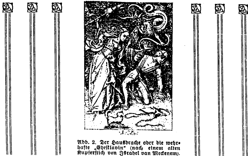
Abb. 2. Der Hausbrache oder die wehrhafte „Eheklavin“ (nach einem alten Kupferstich von J. Strahl van Meenen).

unfänglich wenig leisten, aber so enorme Summen von Volksvermögen und schwerer Männerarbeit leichtsinnig vergeuden. Die „erwerbende“ Frau ist ein guter, den Männern aber sehr teuer zu stehen kommender Mist!