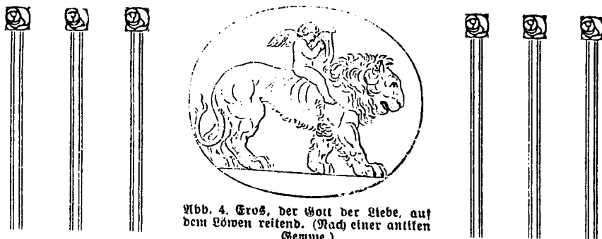
Abb. 4. Groß, der Gott der Liebe, auf dem Löwen reitend. (Nach einer antiken Gemme.)