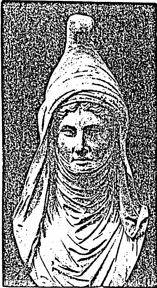
Antike Marmorbüste einer Kranlerin (Brit. Museum, Abb. aus v. Sienkewski: „De simulacris barbarum gentium“). Typus eines vollendet schönen Weibes hervorragender Rasse. Man beachte das wellige Haar, wie es nur der blonden Complexion zukommt, ferner die schöne Stirne, die geraden Augenbrauenbogen, die schmale, lange Nase, den kleinen Mund und die ausgeprägte Vaugenbildung.

Das Recht hat zu ordnen das Verhalten des Menschen zu seiner eigenen Person, zu Gott, zu seinen Mitmenschen und zu seiner sachlichen Umgebung. Der minderrassige Mensch hat jedoch weder ein stark entwickeltes Selbstbewußtsein, noch weiß er von Gott etwas, noch kümmert er sich um seine Stammesgenossen (den Geschlechtsverkehr ausgenommen), noch hat er eine Ahnung von Sachenrecht, falls es sich um mehr handelt als um eine Baumnuss, oder einen Fleischbroden, den er bei seiner Mahlzeit eben in der Hand hält. Der Bolschewismus, das typisch schandalische „Recht“, oder eigentlich „Unrecht“ beweist dies augenfällig! Indes erkennen wir auch schon bei den Minderrassigen und auch bei den Tieren, wo die Ansätze alles Rechtes zu suchen sind: sie sind im Geschlechts- und Nahrungstrieb zu suchen. Es wäre von Belang, der Einwirkung dieser beiden Triebe auf die Entstehung des Rechtes weiter nachzugehen, doch sind ja diese beiden Triebe auch der Urgrund aller Kultur. Es wäre daher eine Erörterung dieses Gegenstandes eine Art Urgeschichte der Kultur, die ich jedoch an dieser Stelle nicht geben will. Doch handelt es sich an dieser Stelle hauptsächlich darum, den Ur-