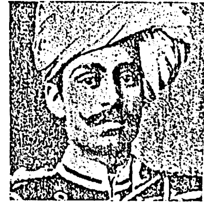
Moderner indischer Offizier, Typus der jehigen, durch Weiberzuchtlosigkeit entarteten Ando-Tschandalen. Die großen vorwärtstenden Augen mit hochgeschwungenen Augenbrauenbogen und die breiten Augenlider sind mediterranoides, Mund, Nase, straffes Haar mongoloides Erbgut, verhältnismäßig leichte Haut und besserer Allgemein-Eindruck schwächer heroider Einschlag. Dieser Mannestypus, der auch in Europa sehr häufig ist, ist der Typus des sogenannten „schönen, interessanten Mannes“, der sich bei den Frauen großer Beliebtheit erfreut.

All das kann jedoch dem Gesehe des göttlichen Lehrers Manu nicht Eintrag tun. Im Gegenteil, es beweist nur schlagend, wie richtig seine rassenwirtschaftlichen Maßregeln waren, und wie bitter sich die Uebertretung der heiligen Gesetze gerächt hat.