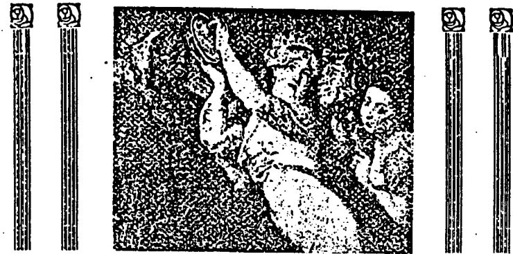
Abb. 1: Blondine in einem Bacchanal. (Nach P. B. Rubens.) Reger und primitiver Faun umschärmen in zudringlicher Weise die in Ekstase befindliche Blondine. Rechts wird ein Dunkelrassenweib, der Typus der verschmierten Kupplerin, Sexualerpresserin und Demuziantin sichtbar. Die ganze Komposition ist tief symbolisch und von meisterhafter Charakteristik.

Die kindlichen und urmenschenlichen Merkmale des weiblichen Körpers.