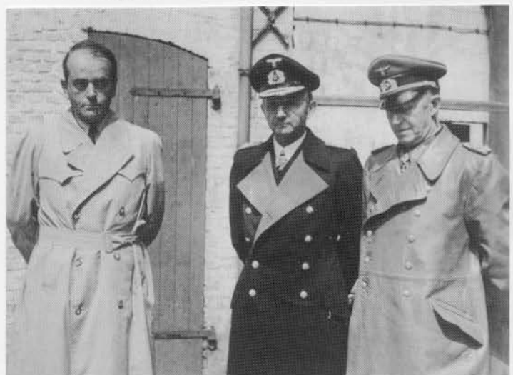
Nach Absetzung und Gefangennahme der Regierung Dönitz im Mai 1945. (Von links) Albert Speer, Großadmiral Karl Dönitz, Generaloberst Alfred Jodl.

"Falsch wäre es zu glauben, daß sich die führenden Leute, wenn sie sich selten genug trafen, mit ihren Untaten gebrüstet hätten. Im [Nürnberger] Prozeß wurden wir zwar mit den Chefs einer Mafia verglichen. Ich erinnere mich an Filme, in denen die Bosse der legendären Gangs im Smoking zusammensaßen, sich über Mord und Macht unterhielten, Intrigen spannen, Coups ausheckten. Doch diese Atmosphäre von Dunkelmännern, Hinterstube und Verschwörung war von der unseren weit entfernt." 44) S. 43 - 44