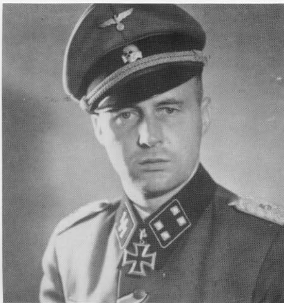
Christian Wirth, Foto aus seiner Personalakte des Bundesarchivs, Berlin, Finkensteinallee 63.