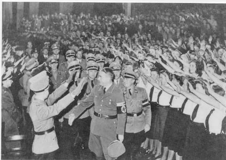
Begrüßt vom Reichsjugendführer Artur Axmann rief Albert Speer am 18. Oktober 1943 in Berlin die deutsche Jugend, speziell die Lehrlinge der Rüstungsindustrie zu höchsten Kraftanstrengungen auf, um die Deutsche Wehrmacht in ihren harten Kämpfen mit den erforderlichen Waffen zu versorgen.