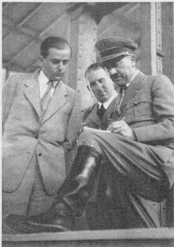
Der Führer und sein Architekt, als sie sich noch mit Bauplanungen im Reich befaßten.

"Ich halte das Affidavit für erlogen. Ich möchte sagen, in dem deutschen Volk gibt es etwas Derartiges nicht. Und wenn derartige Einzelfälle auftraten, dann wurden sie bestraft bei