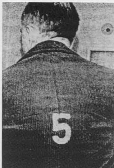
Mit Hilfe einer in die Spandauer Zelle eingeschmuggelten Kleinbildkamera wurde diese Aufnahme des "Kriegsverbrechers Nr. 5" gemacht. Den Gefängnisvorschriften gemäß durften die Gefangenen nicht mit Namen, sondern mußten mit ihrer Nummer angeredet werden.

"Diese Juden werden vermutlich in den deutschen Fabriken arbeiten müssen, die unlängst in den Bezirk Krakau verlegt worden sind." 74) S. 232