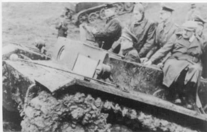
Albert Speer in der Wanne des neuen "Ferdinand" anlässlich der Erprobung neuer Panzertypen 1943 auf dem Schlammgelände des Nibelungenwerkes bei Linz. Hinter ihm auf dem Rand sitzend in Zivil Ferdinand Porsche. Die "Panzer-Tiger-Kommission" hatte zeitgleich entschieden, den »Henschel«-Tiger und den »Porsche«-Tiger unabhängig voneinander zu fertigen.

Daß diese Schutzbestimmungen, die das RSHA der Wehrmacht gegenüber ausdrücklich bestätigte, in den folgenden Monaten zunehmend in Frage gestellt wurden, beweist der letztlich erfolgreiche öffentliche Widerstand der in »Mischchen« lebenden Frauen gegen den Abtransport ihrer Männer Anfang 1943 in Berlin." 21)