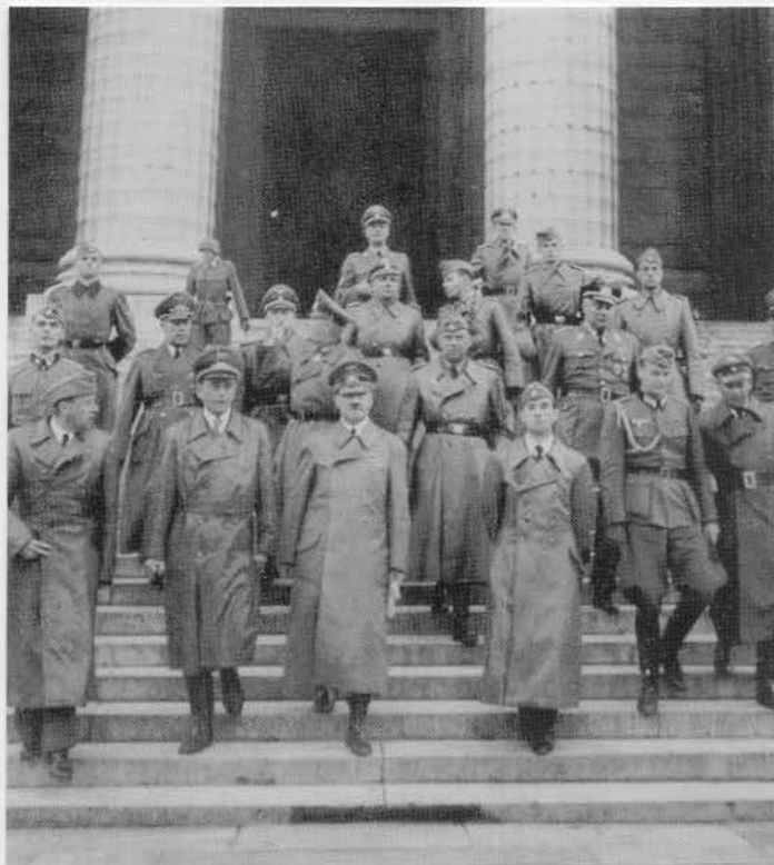
Nach Ende des Frankreichfeldzuges: Der Führer verläßt im Juli 1940 St. Madeleine/Paris. Von links vorn im Bild n. r. Prof. Hermann Giesler, Albert Speer, Hitler, Prof. Arno Breker

Dies alles widersprach nicht nur den angeblichen Ausführungen Himmlers in Posen und Sonthofen, sondern auch Speers dümmlicher "Vermutung", Hitler habe um die Aus-