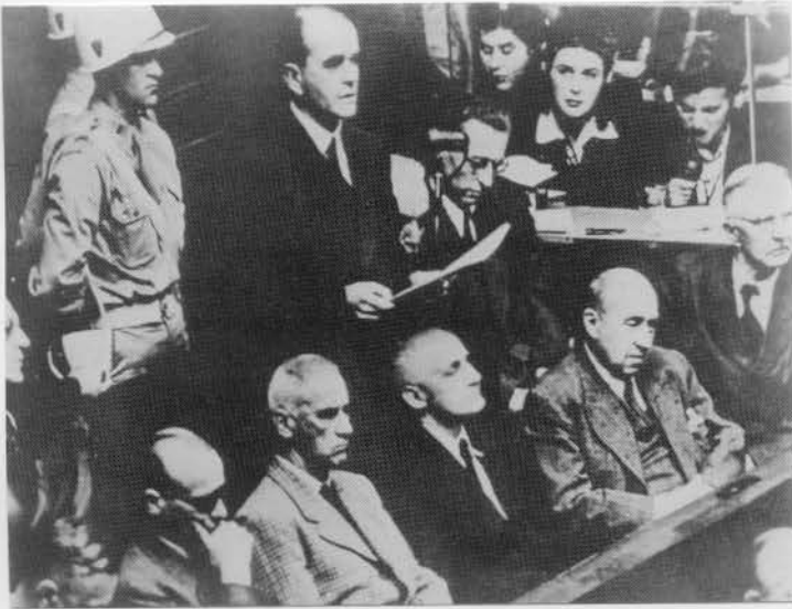
Der als Hauptkriegsverbrecher angeklagte Albert Speer bei seinem Schlußwort in Nürnberg, August 1946