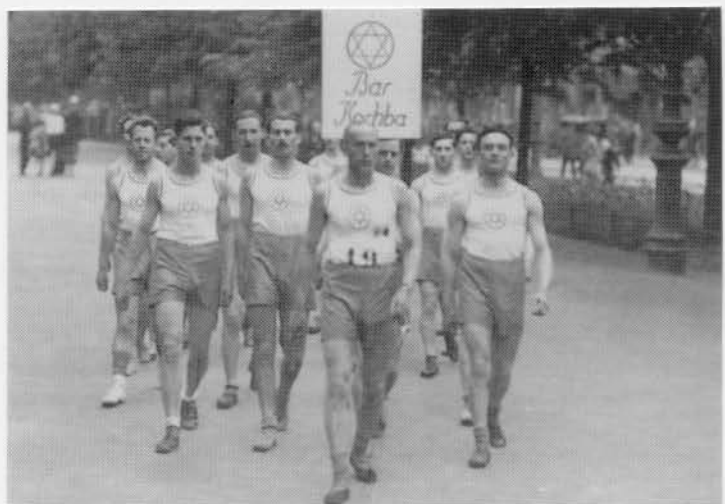
Der Stettiner Sportverein »Bar Kochba« 1929

Zum Schluß ist noch zu berichten, daß mir 14 Tage nach der Ratifizierung des Israel-Vertrages [1952] von jüdischer Seite für das der Bundesregierung übergebene Memorandum zum Israel-Vertrag DM 30.000,- geboten wurden. Ich hätte sie gerne genommen. Ich konnte sie -- ich war arm wie Millionen deutscher, europäischer Schicksalsgenossen -- gut gebrauchen. Aber aus dem »Geschäftchen« konnte nichts werden. Es war eine kleine Bedingung daran geknüpft. Ich sollte vor Erhalt des Geldes eine Erklärung unterzeichnen, daß dieses Memorandum nie existent gewesen sei. Auf meine bescheidene Frage, wen man alsdann mit dieser Erklärung erpressen wolle, die Bundesregierung oder mich?, erhielt ich keine Antwort. ..."