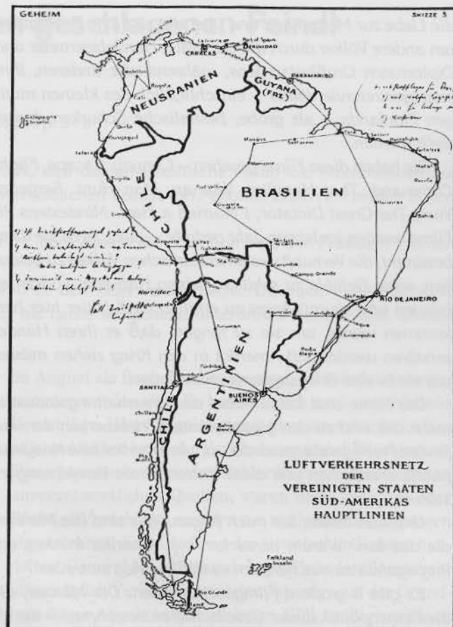
Gefälschte britische Landkarte mit angeblich deutschen Eroberungszielen in Südamerika. "Intrepid" war im September/Oktober 1941 Zulieferer über seine Außenstation auf Bermuda. Roosevelt spielte dieses Falsifikat unverzüglich als "authentisches Belegstück" für Hitlers Angriffsplanung auf die USA von Südamerika aus hoch.

Bei dem vorliegenden Überblick über dieses Buch verzichten wir bewußt auf die Wiedergabe zweifellos interessanter geheimdienstlicher Details, die BSC nach Kriegseintritt der USA am 7. (japanischer Überfall auf Pearl Harbor auf Hawaii) bzw. 11. Dezember 1941 (deutsche Kriegserklärung) bis Kriegsende sowohl auf dem Sektor der Spionage als auch des Kampfeinsatzes der Guerilla-Kommandos sowie der Dokumentenfälschungen durchgeführt hat, weil sie die politische Geschichte verlassen und in die Kriegsgeschichte einzuordnen sind.