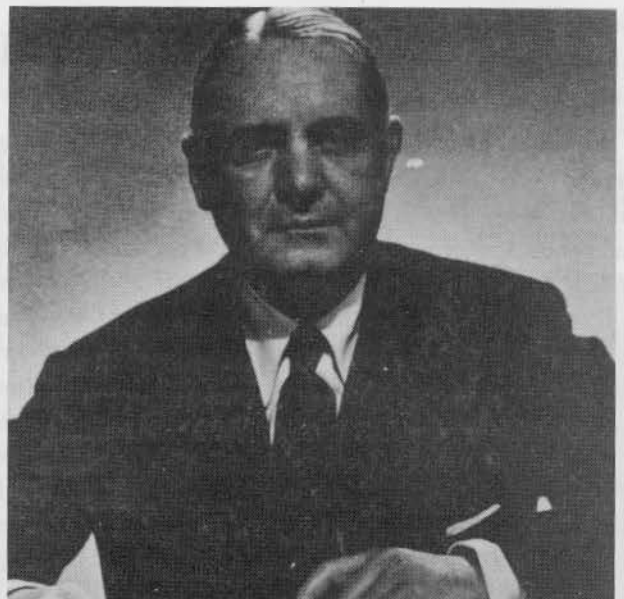
General William "Wild Bill" Donovan, Gründer und Chef des Office of Strategic Services (OSS) arbeitete während des ganzen Krieges eng mit Intrepid zusammen. Sein US-Geheimdienst wurde indessen außerordentlich stark von kommunistischen Agenten unterwandert und von Präsident Harry S. Truman nach Kriegsende aufgelöst.

Ich kann hier nicht die ganze Geschichte erzählen. Aber Sie haben ein Recht darauf, diese Geschichte zu kennen. Sie haben ein Recht darauf zu wissen, warum patriotische Amerikaner aus allen Ecken angegriffen werden, sobald sie aufstehen, um für Amerika zu sprechen, und warum ihnen Säle und Stadien verweigert werden, während jene jeden Tag 20.000 Kinos benutzen können, um zu 80 Millionen Menschen reden zu können. Aber diese Filmmogule und Regisseure sind angeblich Patrioten -- diese Männer, die ihre Filme erst vor ein paar Jahren mit so viel Unmoral und Schmutz gefüllt haben, daß die großen christlichen Kirchen dagegen auftreten und protestieren mußten und die Liga für Sittlichkeit einrichten mußten, um dies zu stoppen. Sie haben ein Recht, alles über diese schäbige Geschichte der Kriegspropaganda im Film zu wissen, und der Senator Bennett Clark und ich, wir haben heute den US-Senat dazu aufgerufen, dies zu untersuchen. Wir wollen wissen, welche Rolle die Regierung darin gespielt hat -- und ob die Regierung hier, wie die Regierung in Hitlers Deutschland und Mussolinis Italien, diese Filme dazu benutzt, um die Seelen des amerikanischen Volkes zu vergiften, und zwar gegen den Großteil Europas und um uns in den blutigsten Krieg der Geschichte zu stürzen. Und aus welchem Grunde? Um diese Welt sicher zu machen für den britischen Imperialismus und den russischen Kommunismus? ..."