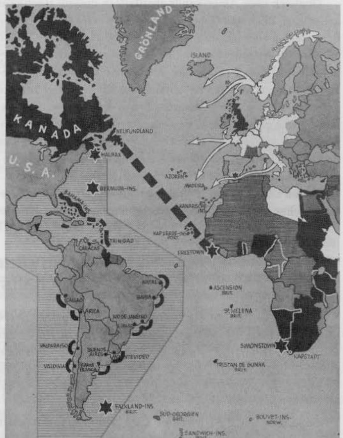
Britischer Blockadesperrgürtel gegen das kleine Deutschland, das angeblich die ganze Welt beherrschen wollte.

Morgenthau hat sich überhaupt als der beste heimliche Unterstützer für Stephenson neben Roosevelt erwiesen.