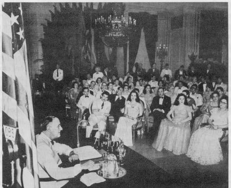
F.D. Roosevelt leistete sich diesen Rahmen, um die geladenen südamerikanischen Diplomaten mit ihren Ehefrauen am 27. Mai 1941 auf "seine Sorgen um Südamerika vor den Aggressionsgefahren durch Deutschland und Italien" einzustimmen. Wer wollte da schon in dieser erlauchten Gesellschaft von Kriegsanstiftung durch Roosevelt selbst sprechen?

Richter- und Staatsanwalt-Posten. So hat F.D.R. über die Hälfte der Bundesrichter-Stellen mit seinen „demokratischen“ Parteifreunden bereits 1933/1934 neu besetzen lassen. Von über 200 gehörten nur noch 4 der republikanischen (?) Partei an. 3) S. 421