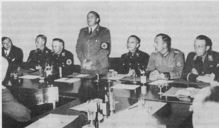
Tagung des Polizeiausschusses am 13.11.1938 nach der "Reichskristallnacht" in der Akademie für deutsches Recht in Berlin.

Tage festgelegt, im Gegensatz zu den Urteilen der Justiz wegen Arbeitsvertragsbruchs, die auf mindestens 3 Monate Gefängnis bis zu einem Jahr lauteten. Der Arbeitsvertragsbrüchige, der in ein Arbeitserziehungslager eingewiesen wurde, war in jeder Hinsicht besser gestellt, als derjenige, der der Justiz zur Aburteilung überstellt wurde. Die Einweisung wurde auch nicht in das Strafregister eingetragen, und Unterkunft, Verpflegung und Behandlung im Arbeitserziehungslager waren im allgemeinen ebenfalls besser als im Gefängnis. ..." 18) (S. 571 - 576)