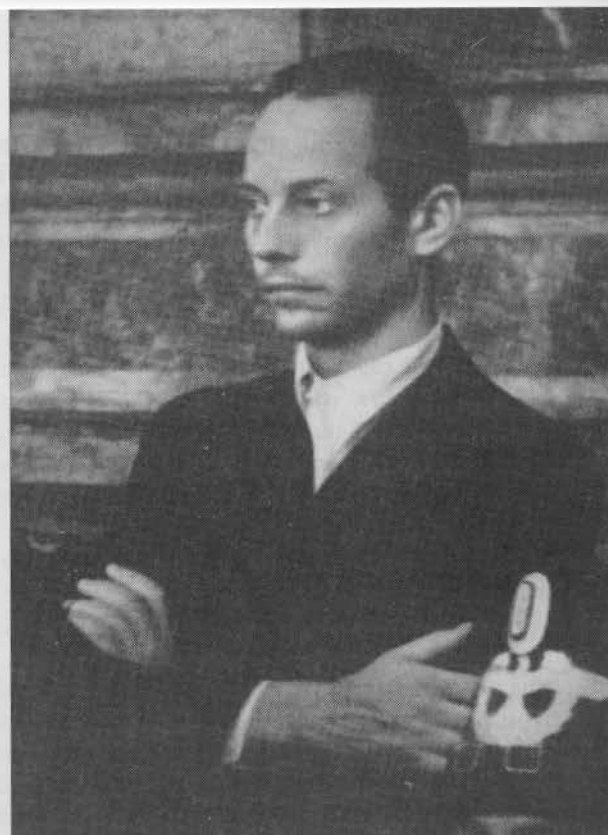
Peter Graf Yorck v. Wartenburg konnte im Rahmen seiner beruflichen Tätigkeit und Reisen viele Verbindungen für die Opposition schaffen. Als Mitbegründer des Kreisauer Kreises und Teilnehmer am Umsturzversuch wurde er am 8.8.1944 hingerichtet.