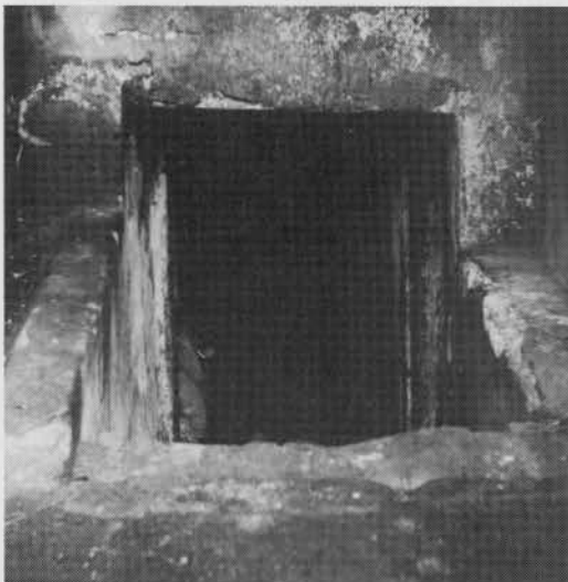
"Warschau 1937: Eingang zu einer Kellerwohnung. Sie war Obdach für 26 jüdische Familien" 9) (S. 80)

Roman Vishniac, jüdisch-russischer Familie entstammend und nach schließlicher Flucht vor dem Bolschewismus in Osteuropa herumreisend und nach 1933 jahrelang in Deutschland angesiedelt -- wir kommen nachfolgend noch auf ihn zurück --, war 1935 vom "Hilfsverein der deutschen Juden" gebeten worden, seine Fachkenntnisse als Fotograf dazu zu verwenden, um das traditionelle jüdische Leben in Osteuropa zu dokumentieren. Seine Spezialität war, unerkannt "aus dem Knopfloch" mit Hilfe seiner deutschen Leica fotografieren und Filme auch unter schwierigen Verhältnissen entwickeln zu können. Seine nun auch in deutscher Sprache herausgekommenen Sammlungen -- zweifellos nur Bruchstücke seiner tausenden von Aufnahmen -- bestätigen die zuvor zitierten Eindrücke des Präsidenten des amerikanischen Judentums Stephen Wise in geradezu erschütternder Weise. Die für diese Dokumentation hier herangezogenen Fotos mit ihren Texten sind beispielhaft für die gesamte Fotosammlung Vishniacs; er hat der Öffentlichkeit keine besseren Verhältnisse des osteuropäischen Judentums aus den dreißiger Jahren vorgestellt.