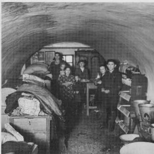
☞ "Warschau 1937: Kellerwohnung eines Lastenträgers und seiner Familie" 118) (S. 81)

⇓ "Kellerwohnung und Werkstatt. Warschau 1939.