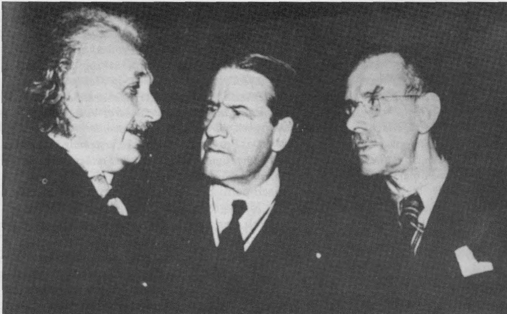
Drei Streiter für die angebliche "zivilisierte Menschheit": Albert Einstein, Stephen Wise und Thomas Mann (rechts)