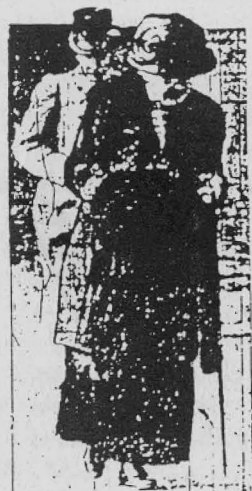
HOLLAND'S QUEEN MOTHER, who will be seventy, at the summer, photographed out walking near Shalsholp.