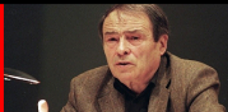
Pierre Bourdieu La mujer objeto de la dominación masculina