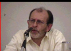
Alain de Benoist La condición femenina