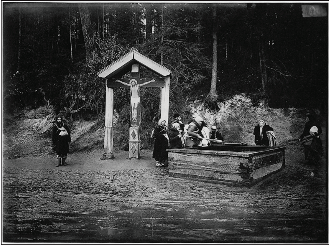
Source sacrée dans le monastère Saint Serafim de Sarov