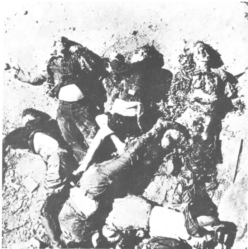
Tijela pripadnika pokreta otpora nad kojima je izvršena smrtna kazna.