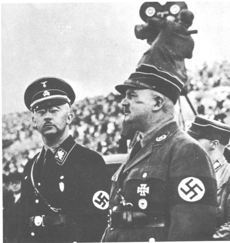
Dva nacisti ka suparnika: Himmler (slijeva), vo a SS-a i Roehm, vo a SA, rame uz rame 1933. godine.