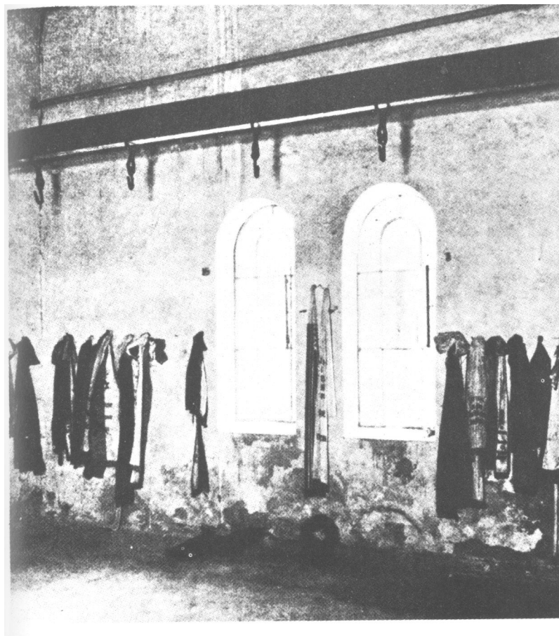
»Mesnica« nakon atentata na Hitlera 20. srpnja 1944. godine: prostorija u berlinskom zatvoru Plötzensee, u kojoj su zavjerenici bili obješeni o mesarske kuke.