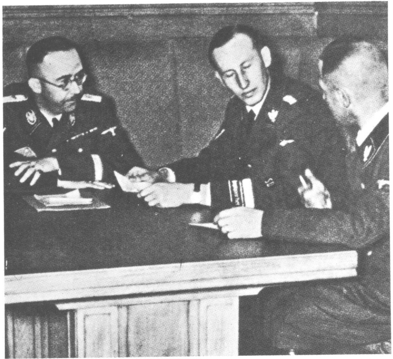
Veliki vođe RSHA za radnim stolom. Slijeva nadesno: Heinrich Himmler, Reinhard Heydrich i Heinrich Müller.