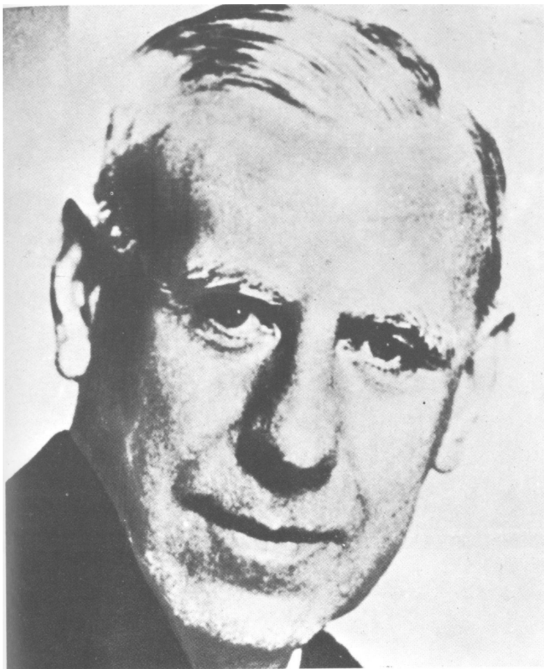
»Stari lisac«, veliki protivnik Gestapoa, antinacisti ki admiral Wilhelm Cănaris, řef vojne obavjeřtajne sluųbe, Abwehra.