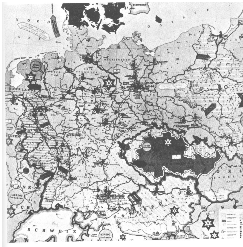
Carstvo Gestapoa u okupiranoj Evropi. Na karti je prikazan razmještaj koncentracionih logora i sjedišta nacisti ke policije.