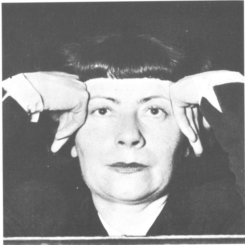
Mnogostruki tajni agent, pripadnica Intelligence Servicea, Sicherheitsdiensta SS-a i pokreta otpora — Mathilde Carré »La Chatte« za vrijeme su enja nakon oslobo enja.