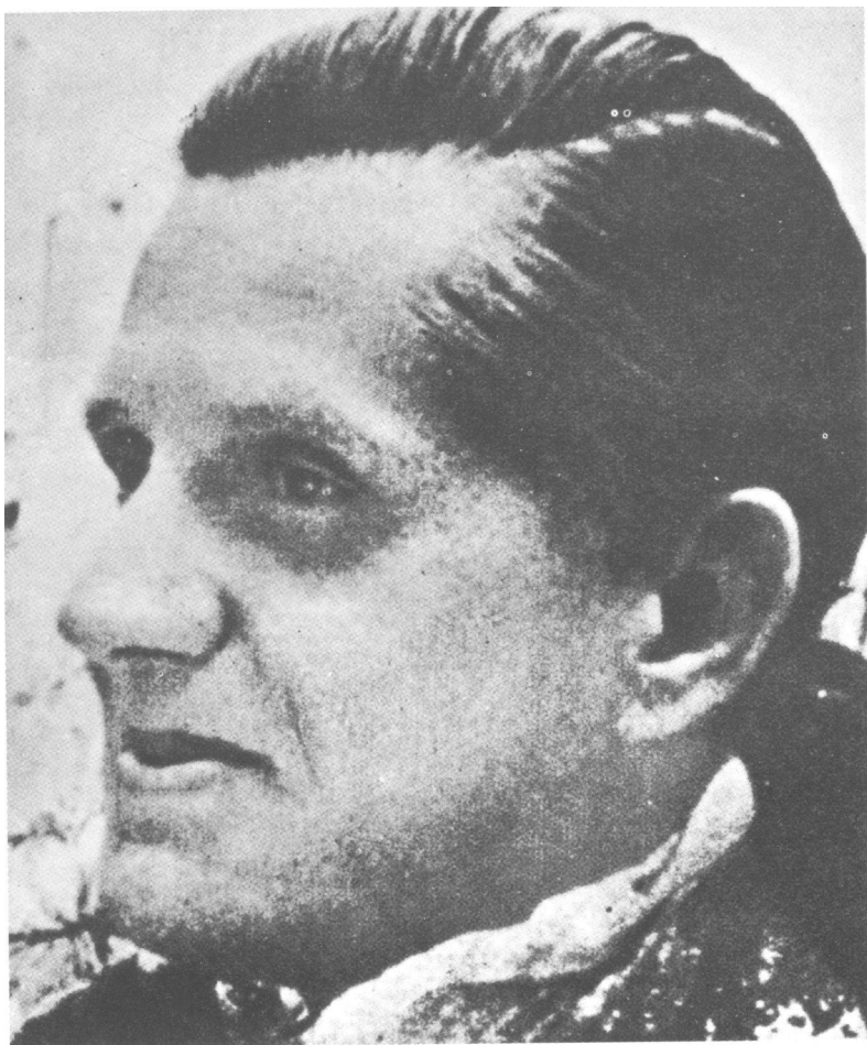
Walter Schellenberg, vođa SD-a za inozemstvo, koji je 1944. godine uhapsiti Canarisa.