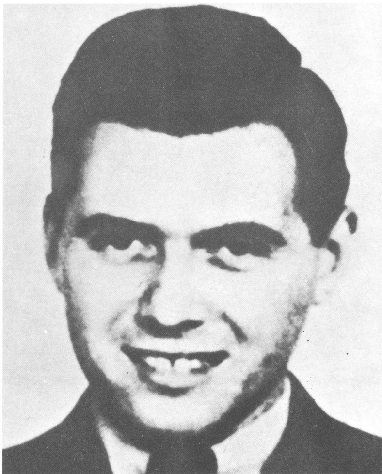
Mengele, lije nik-»eksperimentator« u Auschwitzu. Ova fotografija iz mladosti snimljena je u doba kad je istodobno doktorirao medicinu (u Frankfurtu) i filozofiju (u Miinchenu).