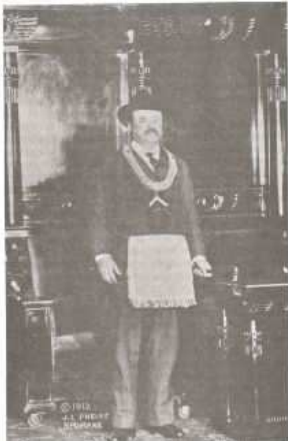
El Gran Maestro Theodore Roosevelt con sus ornamentos masonicos de la Logia 806 de Oyster Bay, Nueva York. Fue presidente de 1901 a enero de 1909. Desde 1907 tuvo motivos de queja por la política de don Porfirio. Su sucesor, Taft, se encargaría de cobrar la cuenta.