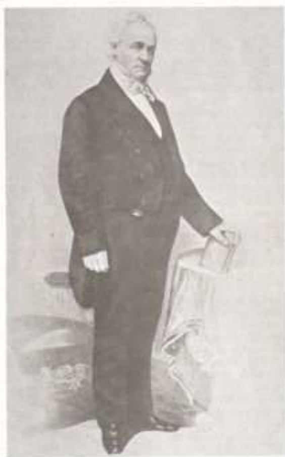
James Buchanan, iniciado en 1816 en la Logia Núm. 43, de Lancaster, Pa., 41 años antes de llegar a la presidencia de Estados Unidos.

"El hecho -escribió después Juárez- será inolvidable para la República Mexicana y en el corazón de los demócratas el nombre de Turner y de los suyos vivirá eternamente".(3)