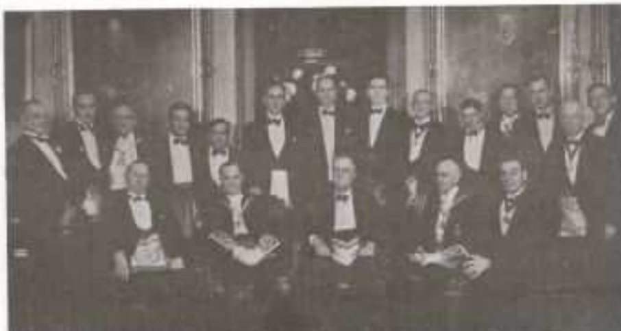
Franklin Delano Roosevelt descendiente del israelita Claes Martensen van Roosevelt, asiste con sus ornamentos masónicos a la "iniciación" de uno de sus hijos en la logia num. 8 de Nueva York. Roosevelt era gran maestro de varias Logias selectas

Con base en esa agitación, Cárdenas le tendió una trampa a Calles para hacerlo aparecer como enemigo del proletariado y lo expulsó de México junto con el líder de la CROM, Luis N. Morones. Calles se hallaba entonces tan mal informado del nuevo rumbo político internacional que había acusado a Cárdenas de "hablar como cualquier conocido comunista". Y al pasar por Brownsville, horas después de ordenado su destierro, declaró: "Nosotros repudiamos el comunismo porque lo consideramos inadaptable a nuestro país, porque el pueblo mexicano lo rechaza" (10 de abril de 1936).