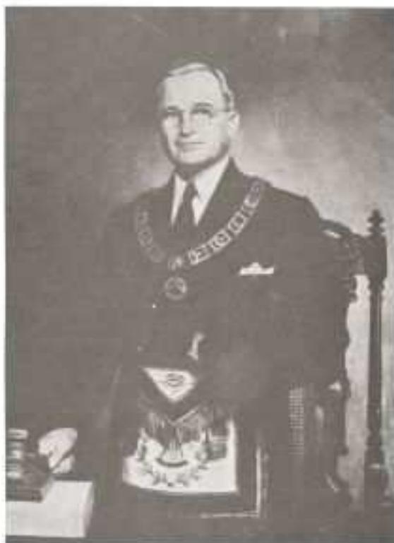
Harry S. Truman, "iniciado" 36 años antes de llegar a la Presidencia, fue luego Gran Maestro en el Templo Masónico de Sto Louis, Missouri. (En este siglo no han sido masones los presidentes Coolidge, Hoover, Kennedy, Nixon y Reagan).