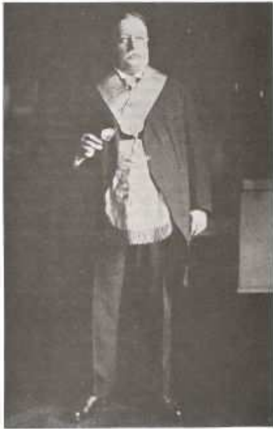
Presidente William H. Taft, Maestro Masón. Usa el delantal Watson y Cassoul del Gran Maestro George Washington, en la Logia Catedral 356 de Cincinnati, Ohio. Su entrevista con Porfirio Díaz fue decisiva.